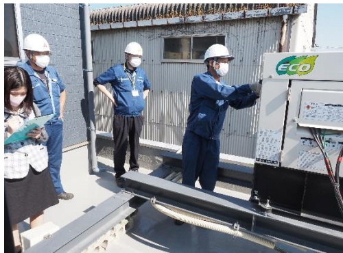
水害対策訓練（発電機の確認）