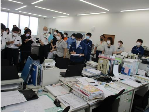
地震対応訓練（対策の指示）