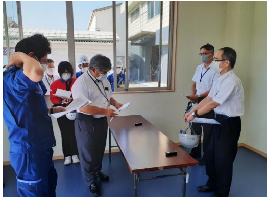
不審者対応（基本対応）