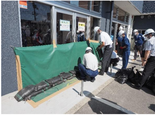
水害対策訓練（土嚢設置）