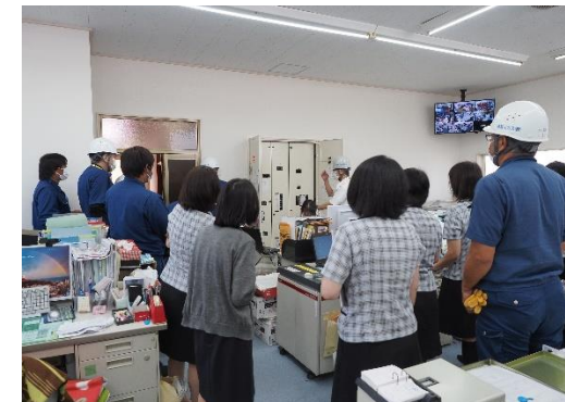
水害対策訓練（分電盤内操作）