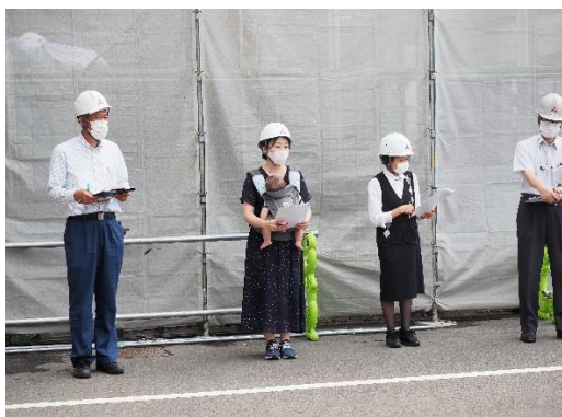
心肺蘇生訓練(心臓マッサージ)