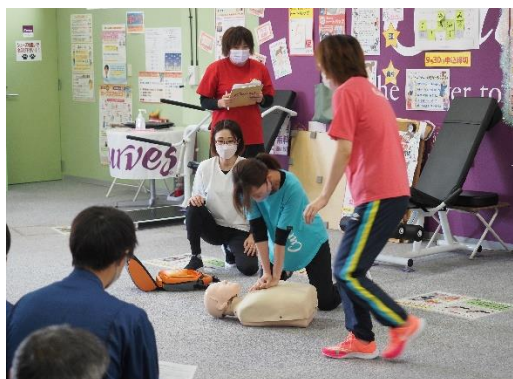
火災対応(初期消火訓練)