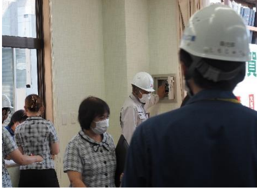
水害対策訓練（水中ポンプ）