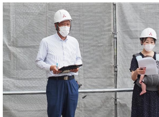
心肺蘇生訓練(AED操作)