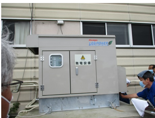
5-3 水害対策訓練（発電機の表示確認）