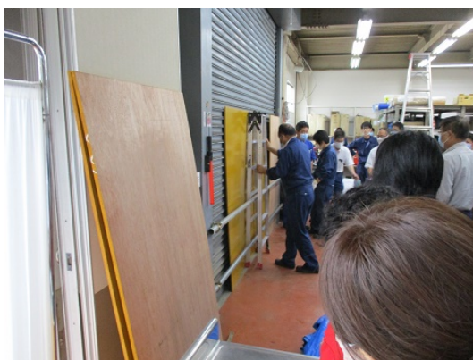
5-7 水害対策訓練（シャッター補強）