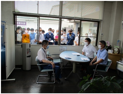
3-1 不審者対応（基本対応）