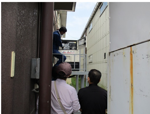
5-1 水害対策訓練（非常用発電機の操作）