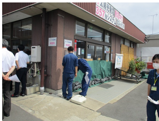
5-6 水害対策訓練（ブルーシート張り）