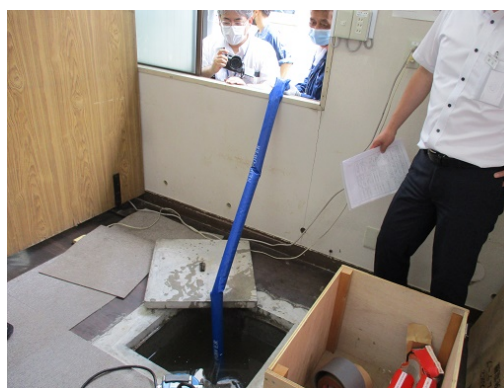
5-8 水害対策訓練（水中ポンプ操作）