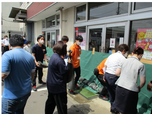
5-5 水害対策訓練（ブルーシート張り）