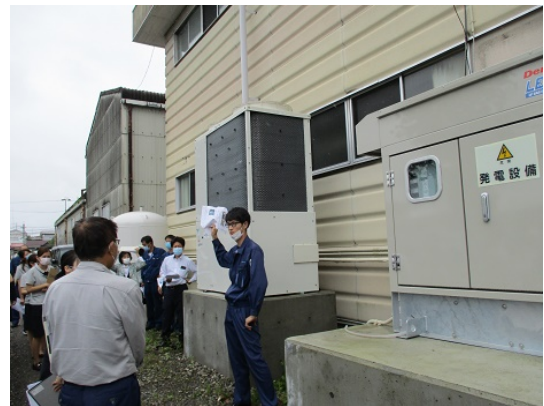
5-2 水害対策訓練（LPガス発電機の操作）