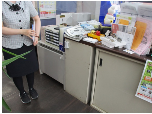
3-2 不審者対応（非常用ボタンの操作）