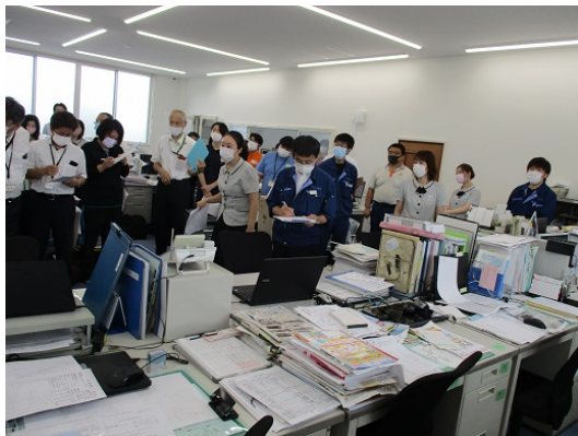
4-1 地震対応訓練（対策の指示）