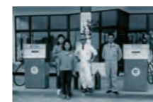
須賀川初・大型24時間営業SS