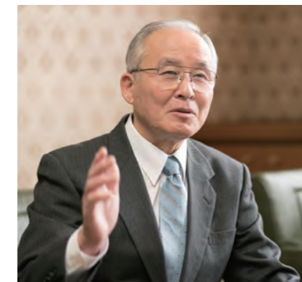
須賀川瓦斯株式会社 代表取締役社長

努力を続けてまいりますので、皆さまのより一層のご理解とご支援を賜りますよう、お願い申し上げます。