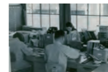
北町事業所(日本社)