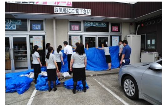
4-4 水害対策訓練（ブルーシート張り）