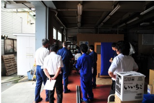
4-1 水害対策訓練（水中ポンプ準備）