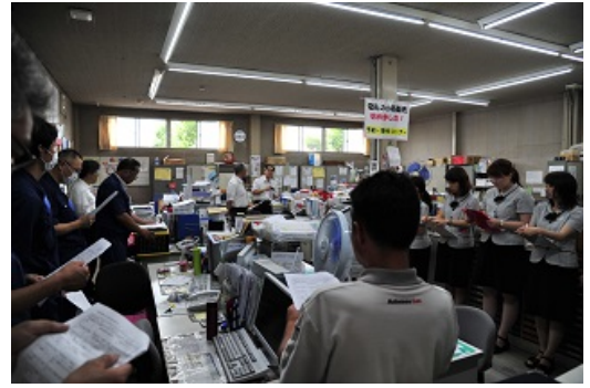
3-2 地震対応訓練（顧客へ電話連絡）