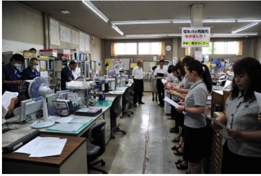
3-1 地震対応訓練（対策の指示）