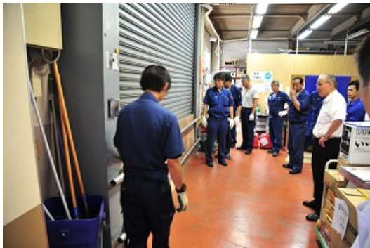
4-5 水害対策訓練（シャッター補強）