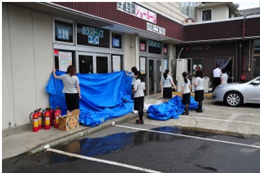
4-3 水害対策訓練（ブルーシート張り）