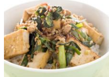
厚揚げマーボー丼